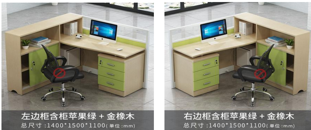
图 2 左右柜效果图