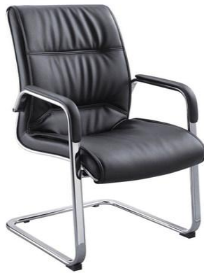
图 5 电脑椅 1 样式图