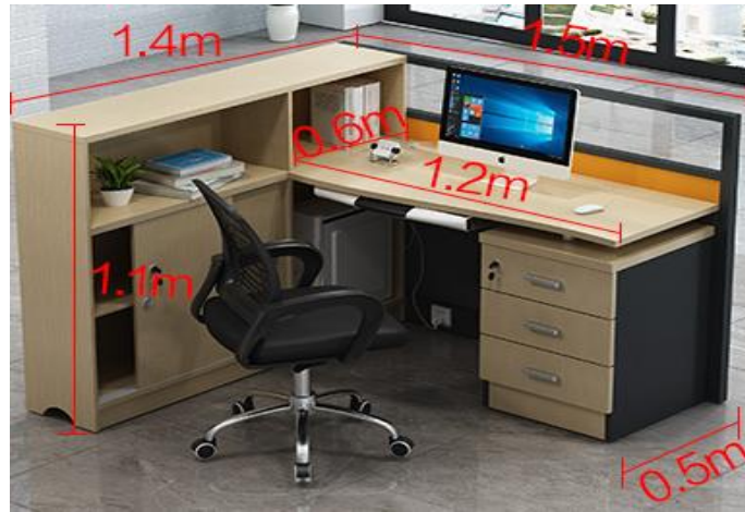
图 1 电脑桌参数图