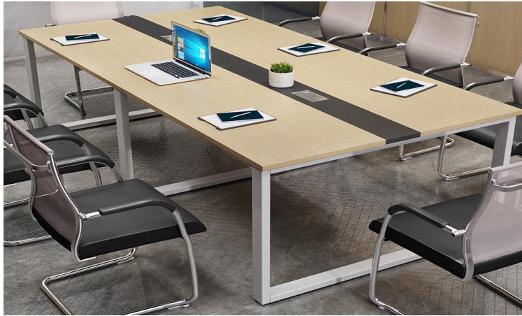
图 4 教研桌效果图