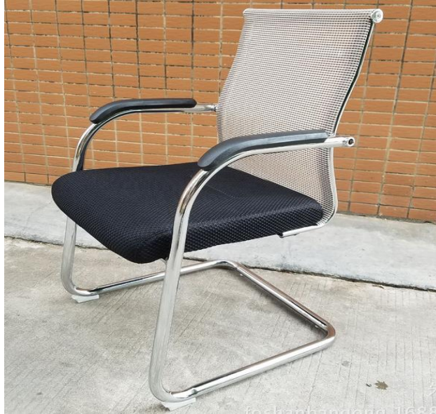
图 7 电脑椅 2 效果图