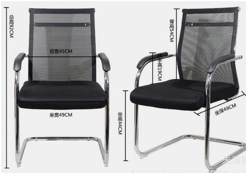
图 6 电脑椅 2 参数图